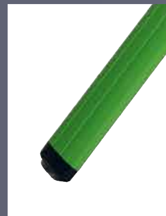
állványba épített csúszásgátló talp