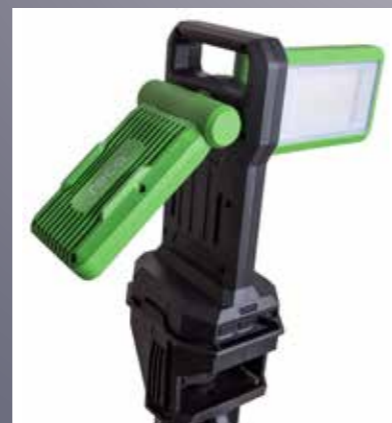
levegő lámpatest tartóval