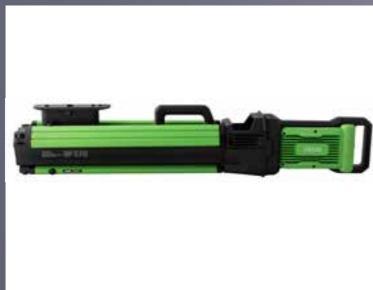
850 mm-esre összecsuksukható, kompakt méretben